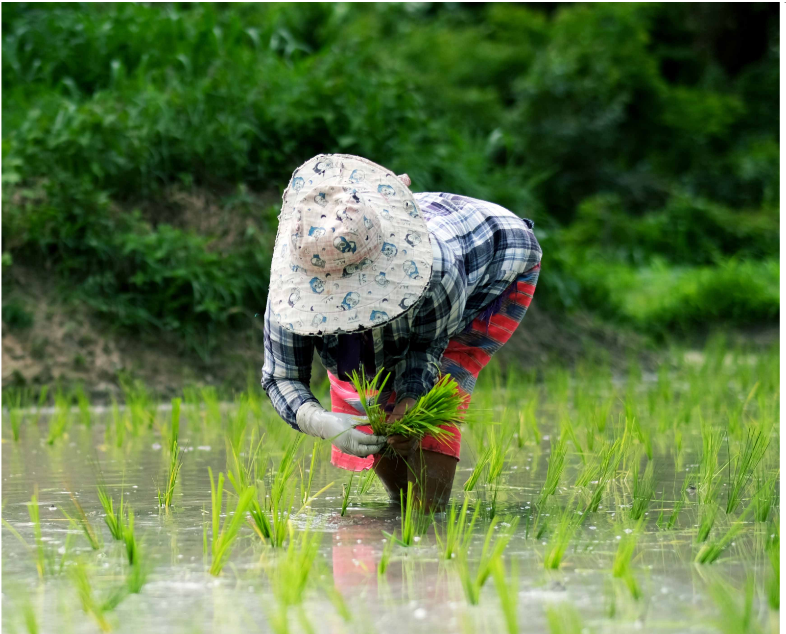
စာမျက်နှာ ၁၊ ၃နှင့် ၈ တွင်ရှိသော ဓါတ်ပုံအားရိုက်ကူးသူ - (Lakpa Nuri Sherpa / AIPP)၊ စာမျက်နှာ ၄နှင့် ၆ တွင်ရှိသော ဓါတ်ပုံအားရိုက်ကူးသူ - (Adivasi Navajeevan Gathan Navajyoti Agua)၊ စာမျက်နှာ ၁၁ တွင်ရှိသော ဓါတ်ပုံအားရိုက်ကူးသူ - (Stefan Thorsell / IWGIA)၊ စာမျက်နှာ ၁၂ တွင်ရှိသော ဓါတ်ပုံအားရိုက်ကူးသူ - (Nakharin Manaboon / Indigenous Media Network)။