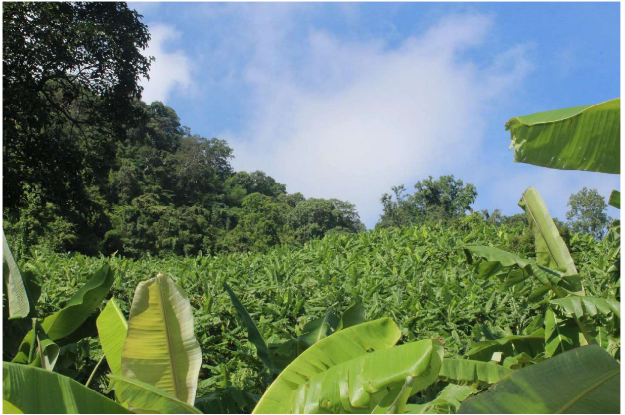
ပုံ(၂) ငှက်ပျောစိုက်ခင်း

အထူးသဖြင့် ရွာသူရွာသားများသည် ဥယျာဉ်ခြံစိုက်ပျိုးရေးကို လုပ်ကိုင်လာကြပြီး ငှက်ပျော၊ ကော်ဖီ၊ သံပရာ၊ ရှောက်၊ မက်မန်း၊ မာလကာ၊ လိမ္မော်၊ ပိန္နဲ၊ ဒညင်း (စူးရှသည့်အနံ့ရှိပြီး အသီးစားကောင်းသော သစ်မာပင်)၊ သီဟိုဠ်နှင့် အခြားနှစ်ရှည်ပင်များကို စိုက်ပျိုးလာကြပါသည်။ ဥယျာဉ်ခြံစိုက်ပျိုးရေးမှ ထွက်ရှိသော သီးနှံထွက်ကုန်များကို နီးစပ်ရာမြို့များသို့ရောင်းချကြပြီး အချို့ကုန်သည်များမှာ သီးနှံ များကို ကိုယ်တိုင်လာရောက်ဝယ်ယူကြပါသည်။ ထို့ကြောင့် ဥယျာဉ်ခြံစိုက်ပျိုးရေးသည် ရွာသူရွာသား များ၏ အဓိက အသက်မွေးဝမ်းကျောင်းလုပ်ငန်းတစ်ရပ်ဖြစ်လာပြီး ရွာမှ လိုအပ်သည့် ဆန်၊ စပါးများ ကို အခြားမြေပြန့်ဒေသများမှ ဝယ်ယူစားသုံးကြပါသည်။ မြေလတ်ရွာတွင် မူလမြေပိုင်ရှင်များနှင့် အခြား အရပ်မှ ရွှေ့ပြောင်းနေထိုင်လာသူများအကြားရှိ မြေယာရရှိပိုင်ဆိုင်မှုအခြေအနေမှာ ကွာဟချက်ရှိပါ သည်။