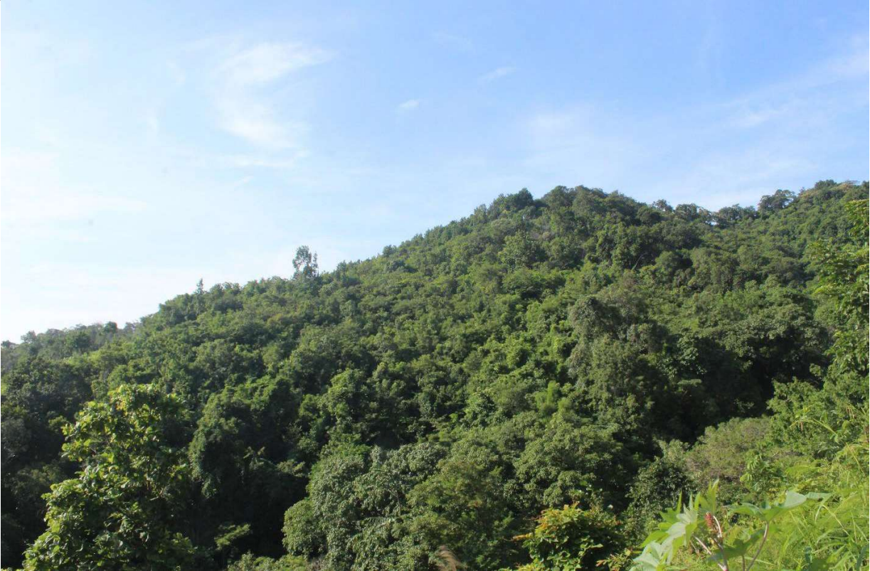
ပုံ(၁) ရွှေ့ပြောင်းတောင်ယာစိုက်ပျိုးမြေမှ ပြန်လည်ဖြစ်ထွန်းလာသော ၁၁နှစ်သားအရွယ်သစ်တော