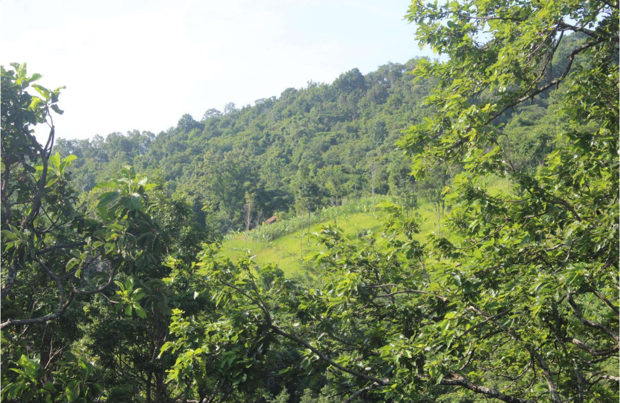
ပုံ (၃) ရွှေ့ပြောင်းတောင်ယာစိုက်ပျိုးခြင်းနှင့် တောင်ကြောတစ်လျှောက် ထိန်းသိမ်းထားသော သစ်တော