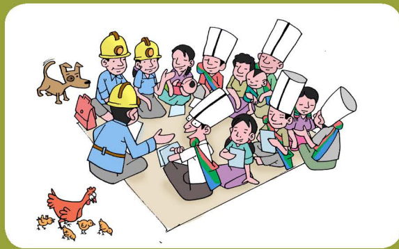
ဒေသခံများအနေဖြင့် စီမံကိန်းအကောင်အထည်ဖော်သူများနှင့် ညှိနှိုင်းမှုများ လုပ်ကို လုပ်ရမည်။