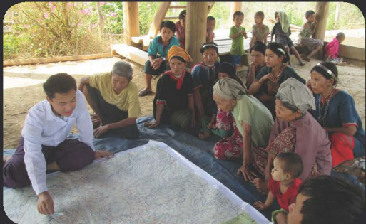
မြေရှင်များနှင့် ဆီလျော်စွာ တိုင်ပင်ဆွေးနွေးခြင်း

သင့်အနေဖြင့် ဒေသခံလူမှုအဖွဲ့အစည်းအပေါ်တွင် သက်ရောက်နိုင်သည့် လူမှု၊ စီးပွားရေးနှင့် သဘာဝပတ်ဝန်းကျင်ဆိုင်ရာ အကျိုးဆက်များကို မသိ၊ နားမလည်ဘဲ စီမံကိန်းနှင့် သက်ဆိုင်သော သဘောတူစာချုပ်များကို လက်မှတ်မထိုးခင် အက်(ဖ)ဖီအိုင်စီ (FPIC) ကို ကြိုတင် နားလည်သိထားရန် အထူးအရေး တကြီး လိုအပ်ပါသည်။