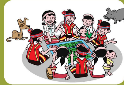
၂။ သင့်ရဲ့ ရပ်ရွာလူထုတွေနဲ့ ဆွေးနွေးပွဲတွေကို ကျင်းပပါ။