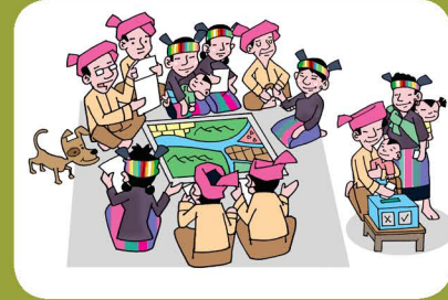
၃။ ရပ်ရွာလူထုတစ်ရပ်လုံးအနေဖြင့် နောက်ဆုံးဆုံးဖြတ်ချက်ချမှတ်ပါ။