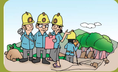
၁။ ဘယ်သူ(ကုမ္ပဏီ)က စီမံကိန်းကို အကောင်အထည်ဖော်မှာလဲ ဆိုတာကို ရှာဖွေဖော်ထုတ်ပါ