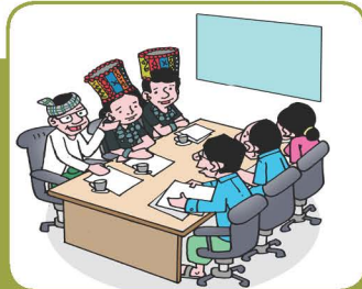
ကိုယ်ပိုင်တရားဝင်အကြံပြုခြင်းကို တောင်းခံပါ

စီမံကိန်းကြီးများ၏ အကျိုးအမြတ်(သို့) ထိခိုက်မှုများသည် ကျယ်ပြန့်ရှုတ်ထွေးပါသည်။ ထို့ကြောင့် သင်နှင့် သင်၏ဒေသအကျိုးကို ကာကွယ်ရန် ဥပဒေပိုင်းနှင့် နည်းပညာပိုင်းဆိုင်ရာ ပညာရှင်များကို ရှာဖွေပြီး စီမံကိန်း၏ အကျိုးဆက်များကို ပိုမိုနားလည်လာအောင် လုပ်ဆောင်ရန် သင့်ထံတွင် အခွင့်အရေးရှိပါသည်။