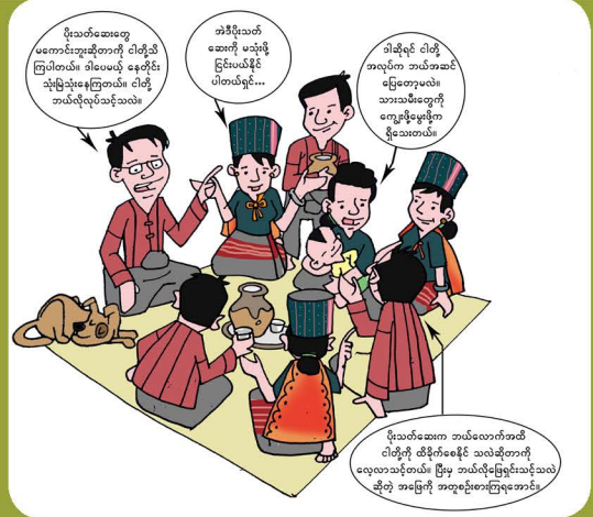
မြေယာပိုင်ရှင်များအကြား ဆွေးနွေးတိုင်ပင်ခြင်း

သဘောတူညီမှုရယူခြင်း - ဆုံးဖြတ်ချက်ချမှတ်သည့် အဖွဲ့အစည်းနှင့် ဒေသခံတိုင်းရင်းသားများအကြားတွင်ရှိသော ရှင်းလင်းပြတ်သားသည့် သဘောတူညီမှုကို သက်သေဖော်ပြမှုသဘောတရားဖြစ်သည်။