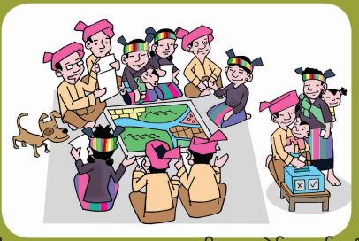
၃။ ရပ်ရားလှို၊ထုအပျ၊အနေး ကထွာဒါး အဆိုင်၊သွတ်၊ဆွဲ၊ဖျတ်ချက် ယို စဉ်းစား၊ချမတ်သွေ့ဝင်၊ပငါပရား။