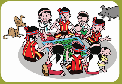
၂။ ဒိုဆောင်းအကိုပါတွမ်း ရပ်မြို့ရပ်ဝါ တွမ်းလှို၊အပျ၊ဖုံး ဆွေ၊နွေ၊တိုင်းပင်၊လွဝင်။