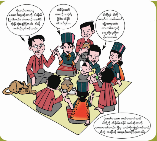
ဆွေ၊နွေ၊တိုင်းပင်၊ဝင်၊ တွမ်းလှိုင်းလျှပ်၊ခြံသား

သဘော၊တူးညှိလ၊ထူးမှ - ဆွဲ၊ဖျတ်ချက် ကချမတ်ဒါး အပျ၊ အပျ၊သားတွမ်း ဒေးသခံခမ်းရင်၊သားအခါးကိုကအဝေးဒါး သျှင်၊ သျှင်၊လျှင်၊လျှင်၊သဘော၊တူး ညှိမှယို ထွာဒားဖေးထန်းနယ် သက်သက်တဟားနပ်၊သျှ။