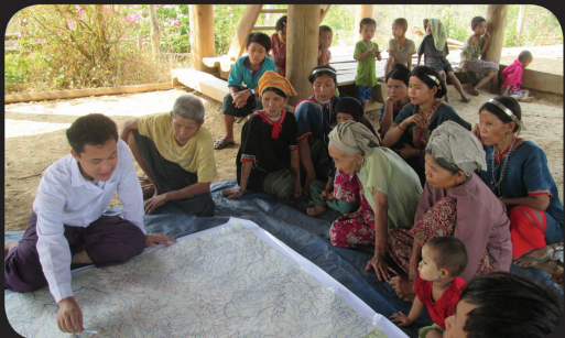
တွိုင်းပင်းရော့၊ရော့သော့ဝင်၊တွမ်း ဟံးဗွေး

နီနာအနေ၊ ဒေးသခံးအစွဲ၊အမူးအလောင်းယို ကထဲလင်၊ဒါး လို၊မုစီးပွားရေ၊ တွမ်း ဆဲင်းရာ၊သဘားဝအသောင်အရင်၊ အကျို၊ အဆို့က်ဆို့က်ဖုံးယိုလဲ မဉ်း တသေထွာတဝ်း ကတဲက်ဆဲင်းဒါး ထာ၊မာ၊ခွင်(စီမံကိန်း ဆိုင်ရာ) ဆဲင်းရာ၊ သဘော၊တူးလိတ် ချုတ်မဉ်းတတမ်းတဝ်းဒွါနီးတွင်၊နပ် အက်(ဖ)ပီအိုင်စီ အကျောင်၊ ခရားယို အဝ်းလိုးသေ့နားရီးဟးနပ်၊ အရေ၊တန်ငါးနပ်၊သွါ။