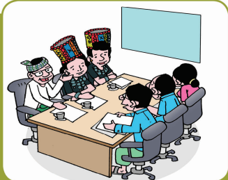
နမ်းပဲင်းတရားဝင် အကျိုးညှာထီးယို ကိုဒျားသော့

(စီမံကိန်း) ထာ၊မာ၊ခွင်ကိုနပ်၊ အကျိုးတွမ်းအဖျတ် (တဝ်းလဲ) ထိခွိုက်မုယိုအဝ်း အာငါးနပ်၊သွါ။ မဉ်းထွားအအိုင်းအလဲင်းနပ်၊ အသျုတ်တရောင်အဝ်းအာတန်သွါ။ ကွယ်းတော့၊ နီတွမ်းနီဒေး သအကျိုးရဲကမ်းကားကွယ်းအီအတား ဆဲင်းရာ၊အနယ်၊ ပညားသျုင်းသီးတွမ်း ဥပဒေပင်၊ဖုံးယို ထွမ်းရီးရီးသျုနုဝ၊မ၊ကွပ်က ထွာဒါး ထာ၊ မာ၊ခွင်(စီမံကိန်း)ယို အကျိုးအဟပ်ဖုံး ဖေးကသေ နားစင်းစုံ၊ ကအီးမာ၊ဟးနင်း ပိုင်၊နပ်၊ နီနာ၊အထူး၊ အခွင်၊အရေ၊ အဝ်းလဲဉ်းဒျားသွါ။