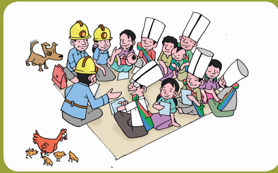
ဒေးသခံသားအနေး ကအီးထေဖေးဒါးထား၊မား၊ခွင်၊(စီမံကိန်း)သားယို တိုင်းပင်၊ဒေး၊ရီဟားဝင်၊နပ်၊သျှ။