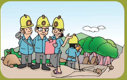
၁။ ပါးမိုင်၊ကုမ္ပဏီယို အီးထေဖေး အနမ်းအခြုံ ကရီ၊နပ်၊ တွမ်းလေ့လာဟားနပ်၊သျှ။