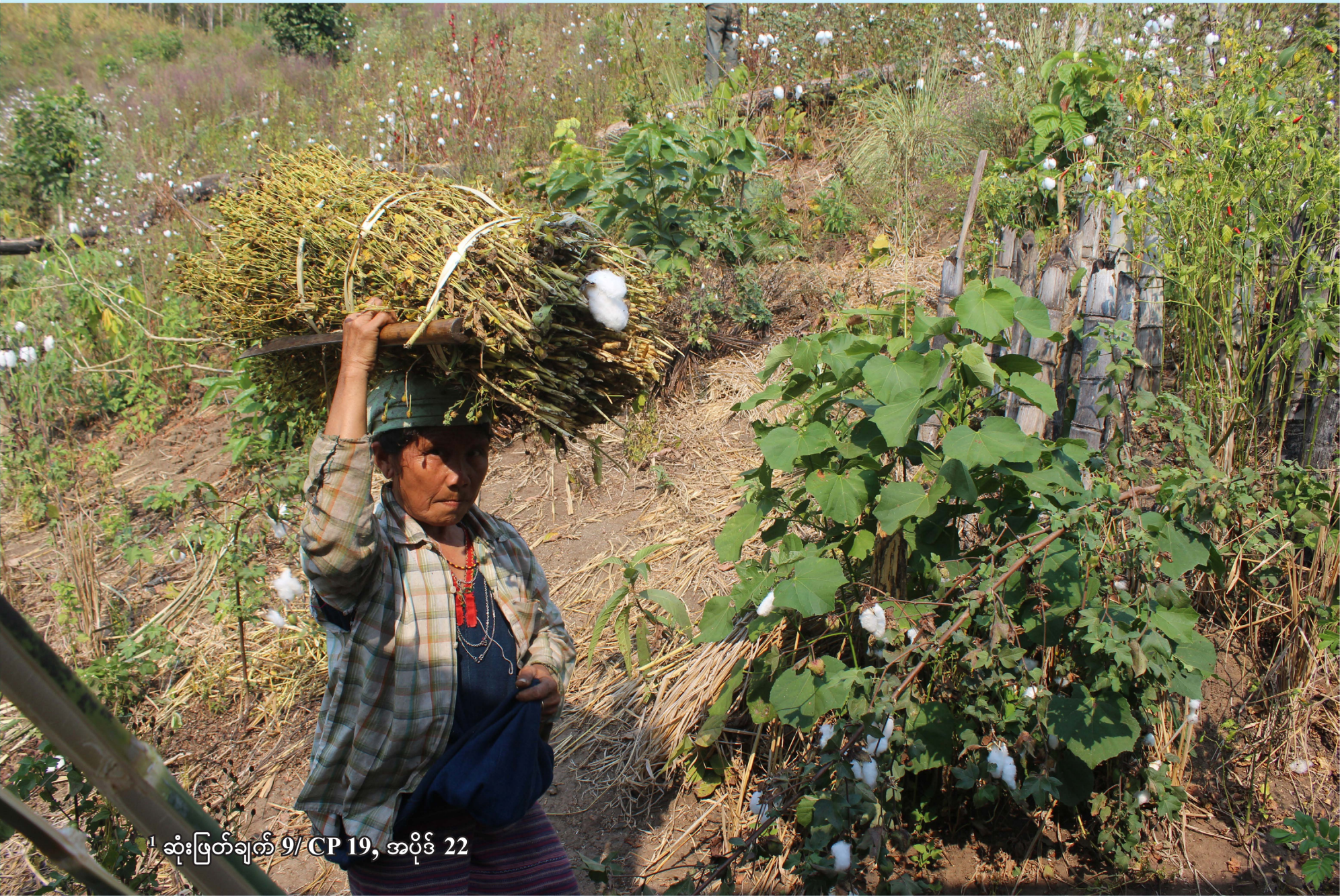
1 ဆုံးဖြတ်ချက် 9/ CP 19, အပိုဒ် 22

အာရှတိုက်သည် ကမ္ဘာပေါ်ရှိ ၃ ပုံ ၂ ပုံခန့်သော ဌာနေတိုင်းရင်းသားများနေထိုင်ရာ ဒေသကြီးတစ်ခုဖြစ်သည်။ အာရှတိုက်ရှိ REDD+ ၁၂ နိုင်ငံဖြစ်သော အင်ဒိုနီးရှား၊ နီပေါ၊ ဗီယက်နမ်၊ လာအို၊ ထိုင်း၊ ကမ္ဘောဒီးယား၊ ဖိလစ်ပိုင်၊ ဘူတန်၊ သီရိလင်္ကာ၊ မြန်မာ၊ မလေးရှားနှင့် ဘင်္ဂလားဒေ့ရှ်နိုင်ငံတို့တွင် လူဦးရေသန်းပေါင်း ၁၅၀ ကျော်သော ဌာနေတိုင်းရင်းသားလူမျိုးများကို တွေ့ရှိရပါသည်။ ဤနိုင်ငံများသည် ၎င်းတို့၏ အမျိုးသား REDD+ စီမံကိန်းများအတွက် သစ်တောကာဗွန်မိတ်ဖက်အဖွဲ့၊ ကမ္ဘာ့ဘဏ်၏သစ်တော ရင်းနှီးမြှုပ်နှံမှုအစီအစဉ်နှင့် ကုလသမဂ္ဂ REDD+ အစီအစဉ်တို့နှင့် ပူးပေါင်းအကူအညီရယူကာ REDD+ လုပ်ငန်းများကို အကောင်အထည်ဖော်လျက်ရှိပါသည်။ ဘူတန်နှင့် ဘင်္ဂလားဒေ့ရှ်မှအပ ဤနိုင်ငံများအားလုံးသည် ကမ္ဘာ့ကုလသမဂ္ဂ ဌာနေတိုင်းရင်းသားများအခွင့်အရေးဆိုင်ရာ ကြေငြာစာတန်း (UNDRIP) ကို သဘောတူလက်ခံခဲ့ပါသည်။ သို့သော်၊ အာရှတိုက်ရှိ နိုင်ငံအများစုတို့သည် ဌာနေလူမျိုးများနှင့် ၎င်းတို့၏ အစုအဖွဲ့ပိုင်အခွင့်အရေးများ အထူးသဖြင့် ၎င်းတို့၏ မြေယာ၊ နယ်မြေဒေသနှင့် သဘာဝသယံဇာတများကို အသိအမှတ်ပြုခြင်းမရှိချေ။