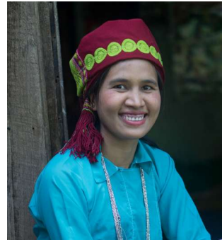
မိုင်လေးလေးခိုင် မကွေးတိုင်းဒေသကြီး၊ ငမဲမြို့နယ်၊ ဘုံးဘောကျေးရွာ