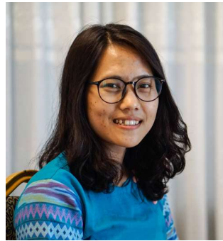
လွင်မာအေး ရွာငံမြို့နယ်၊ သိမ်ကုန်းကျေးရွာ