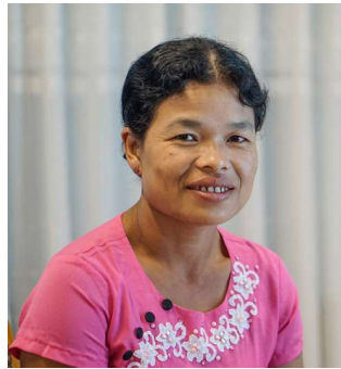
မနင်းမာ ရွာငံမြို့နယ်၊ ကျောက်တောရွာ