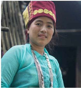
မိုင်စိုးစိုးအေး မကွေးတိုင်းဒေသကြီး၊ ငမဲမြို့နယ်၊ ဘုံးဘောကျေးရွာ