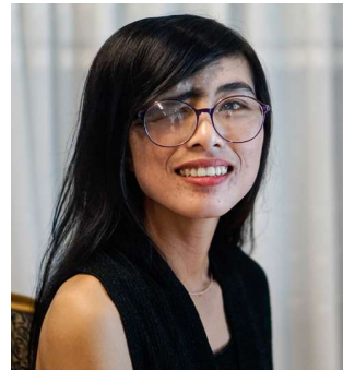
ဖြူလင်သက် ပွင့်လင်းမြင်သာမူဖော်ဆောင်ရေးအဖွဲ့ ကလေးမြို့နယ်၊ ဘော်ဆိုင်းကျေးရွာအုပ်စု ရေဖြူကန်ရွာ