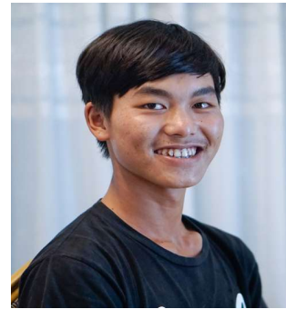
ဝေဖြိုးမောင် ပွင့်လင်းမြင်သာမူဖော်ဆောင်ရေးအဖွဲ့ ကလေးမြို့နယ်၊ ဘော်ဆိုင်းကျေးရွာအုပ်စု ပုန်းတပ်ရွာ