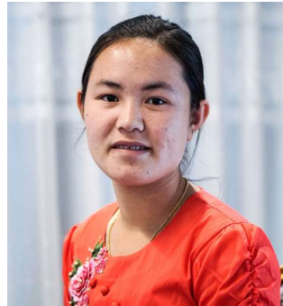
မဥမ္မာ ရွာငံမြို့၊ ကျောက်တောရွာ