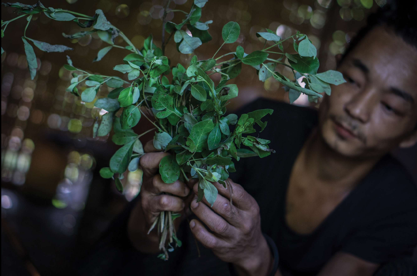
■ ဆေးဖက်ဝင် ကြောင်ပန်းရွက်