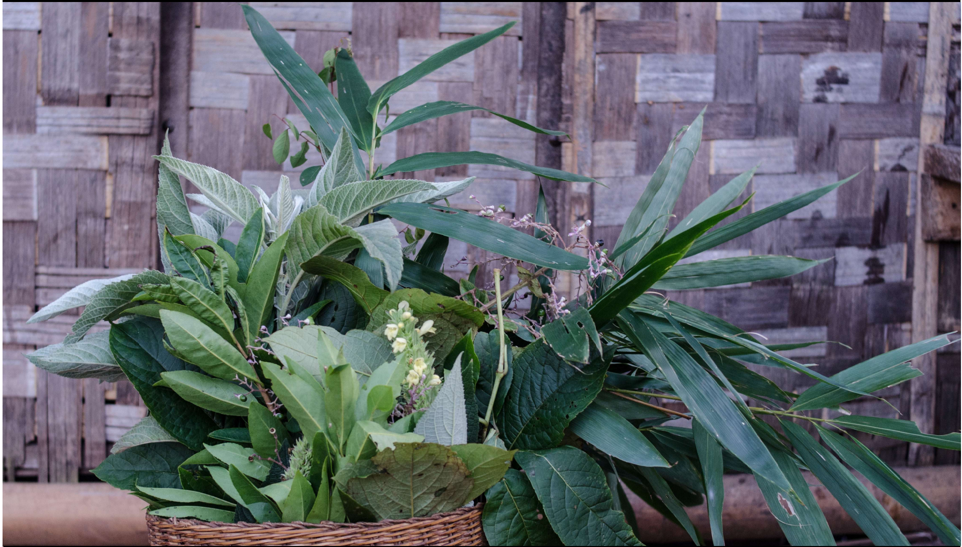
■ ထိုနောက် ၇ မျိုးသောသေးရွက်ကို ခင်းကာ၊ ထိုပေါ်တွင် နီရဲနေအောင် အပူပေးထားသောကျောက်တုံးကို ရေတစ်စက်နှစ်စက်ချကာ မွေးလမ်းကြောင်းကို မီးငွေ့မိအောင် ခံနိုင်ရည်ရှိသလောက် ခံပေးရသည်။