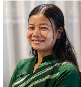
နော်ဝင်းစန္ဒာလွင် ဂေဘားကရင်အမျိုးသမီးရေးရာအဖွဲ့ ပျဉ်းမနားမြို့နယ်၊ဘိုးမအုပ်စု၊ ဘိုးမအထက်ရွာ