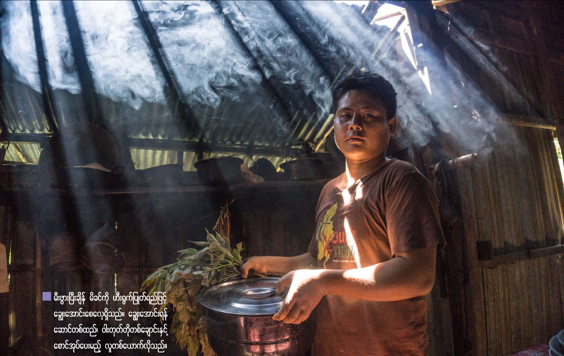
■ မီးဖွားပြီးချိန် မိခင်ကို ဟီးရွက်ပြုတ်ရည်ဖြင့် ချွေးအောင်းစေလေ့ရှိသည်။ ချွေးအောင်းရန် ဆောင်တစ်ထည်၊ ဝါးတုတ်တိုတစ်ချောင်းနှင့် စောင်အုပ်ပေးမည့် လူတစ်ယောက်လိုသည်။