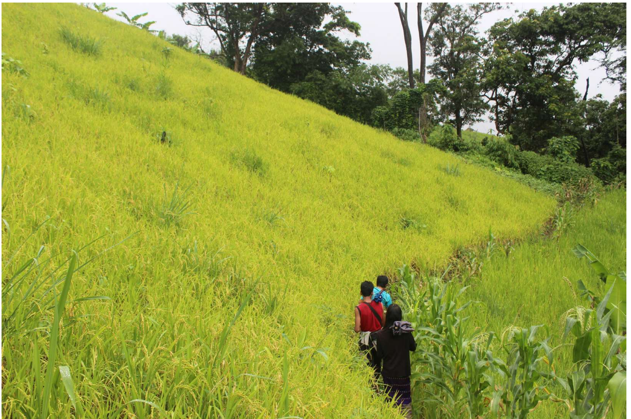
ပုံ(၅) စပါးခင်း