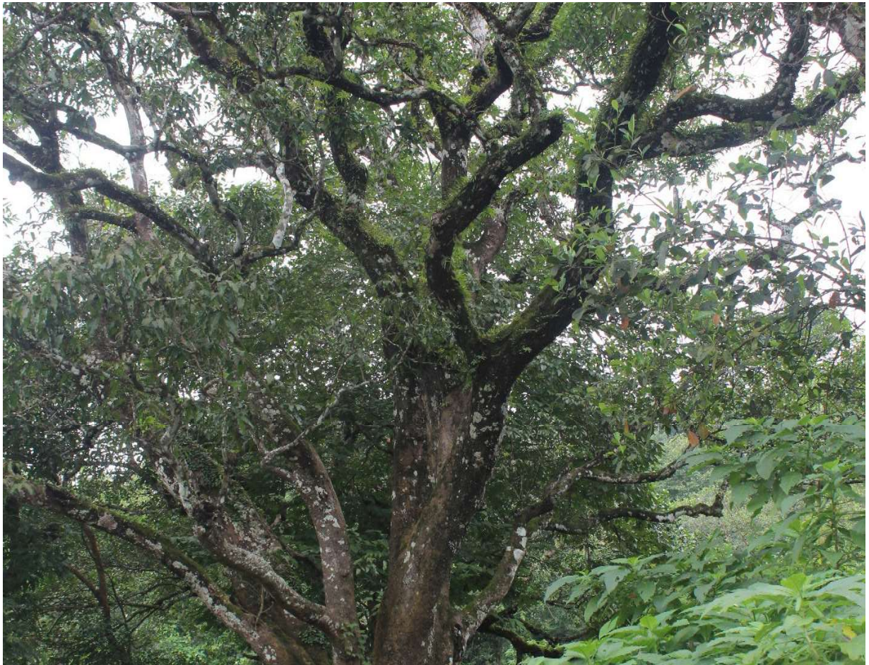
ပုံ( ၃ ) ဆားပေါက်ရွာဟောင်းရှိ သက်တမ်းရှည်သရက်ပင်ကြီး