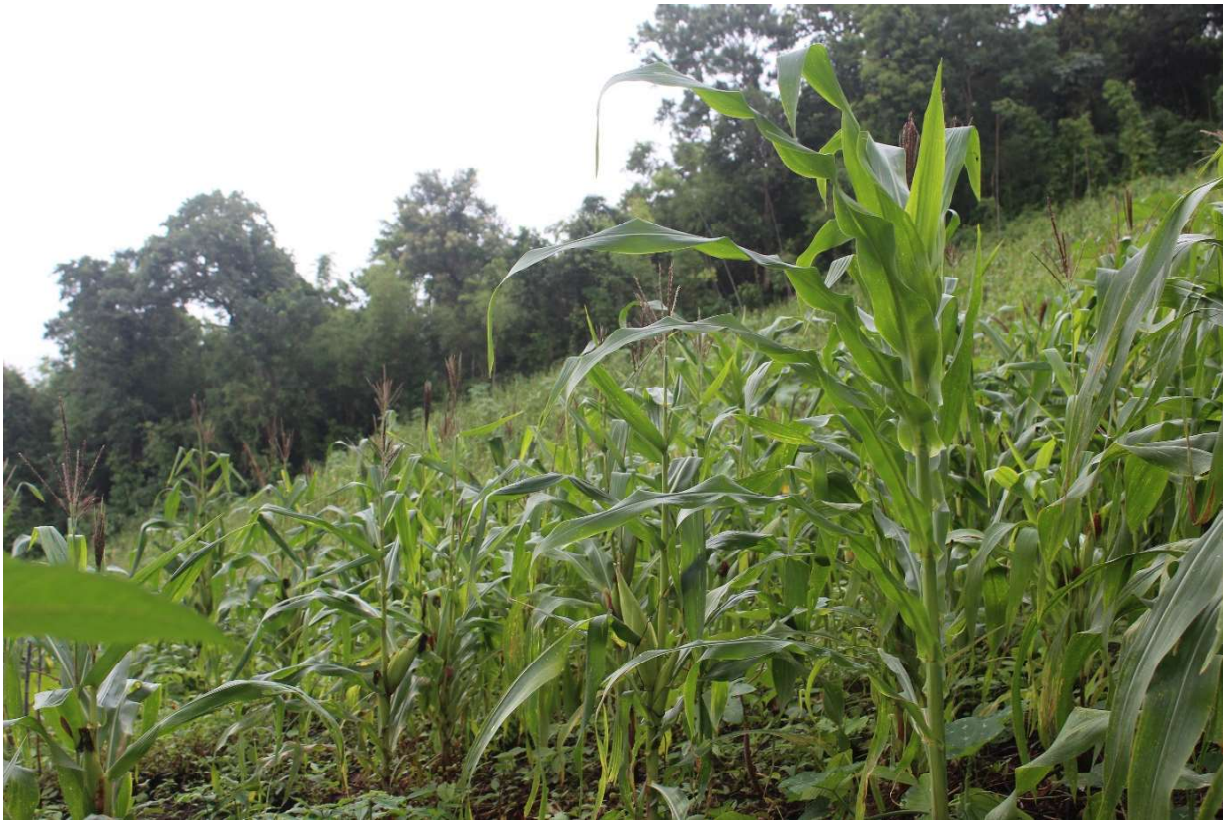
ပုံ(၉) ပြောင်းစိုက်ခင်းနှင့် တောင်ကြောတစ်လျှောက်ရှိ ထိန်းသိမ်းကာကွယ်ထားသောသစ်တော

ရည်ရွယ်ချက်ဖြင့် ကျွန်းပင်များကို စိုက်ပျိုးလိုကြပါသည်။ ဒေသခံပြည်သူ အစုအဖွဲ့ပိုင်သစ်တောတည် ထောင်ခွင့်လက်မှတ်ရရှိထားခြင်းဖြင့် တရားမဝင်သစ်ခိုးသူများကို ကာကွယ်တားဆီးရာတွင် ဥပဒေစိုး မိုးမှုရှိနိုင်မည်ဟု ရွာသူရွာသားများမှ ယုံကြည်နေကြပါသည်။ သို့သော်လည်း အနီးပတ်ဝန်းကျင်ရှိ ကျေးရွာများမှ ရွာသူရွာသားအချို့မှာ ရွာသို့လာရောက်၍ နေအိမ်အဆောက်အဦအတွက် သစ်ထုတ် ယူခွင့် တောင်းခံမှုများရှိပါသည်။ အခြားရွာသူရွာသားများသည် အဆောက်အဦဆောက်လုပ်ရန် အတွက် ဆားပေါက်ရွာပိုင်နယ်မြေအတွင်းမှ သစ်ထုတ်ယူခွင့်တောင်းခံလာသည့်အခါ ရွာအစည်း အဝေးကျင်းပပြုလုပ်၍ သစ်ထုတ်ခွင့်ပေးအပ်ရန် ဆုံးဖြတ်ချက်ချမှတ်ကြပြီး သစ်ထုတ်ခွင့်တောင်းသူ များထံမှ အလှူငွေများ ပြန်လည်လက်ခံရရှိကြပါသည်။ လက်ခံရရှိသည့် အလှူငွေအား ရပ်ရွာဖွံ့ဖြိုး ရေးလုပ်ငန်းများအတွက် အသုံးပြုကြပါသည်။