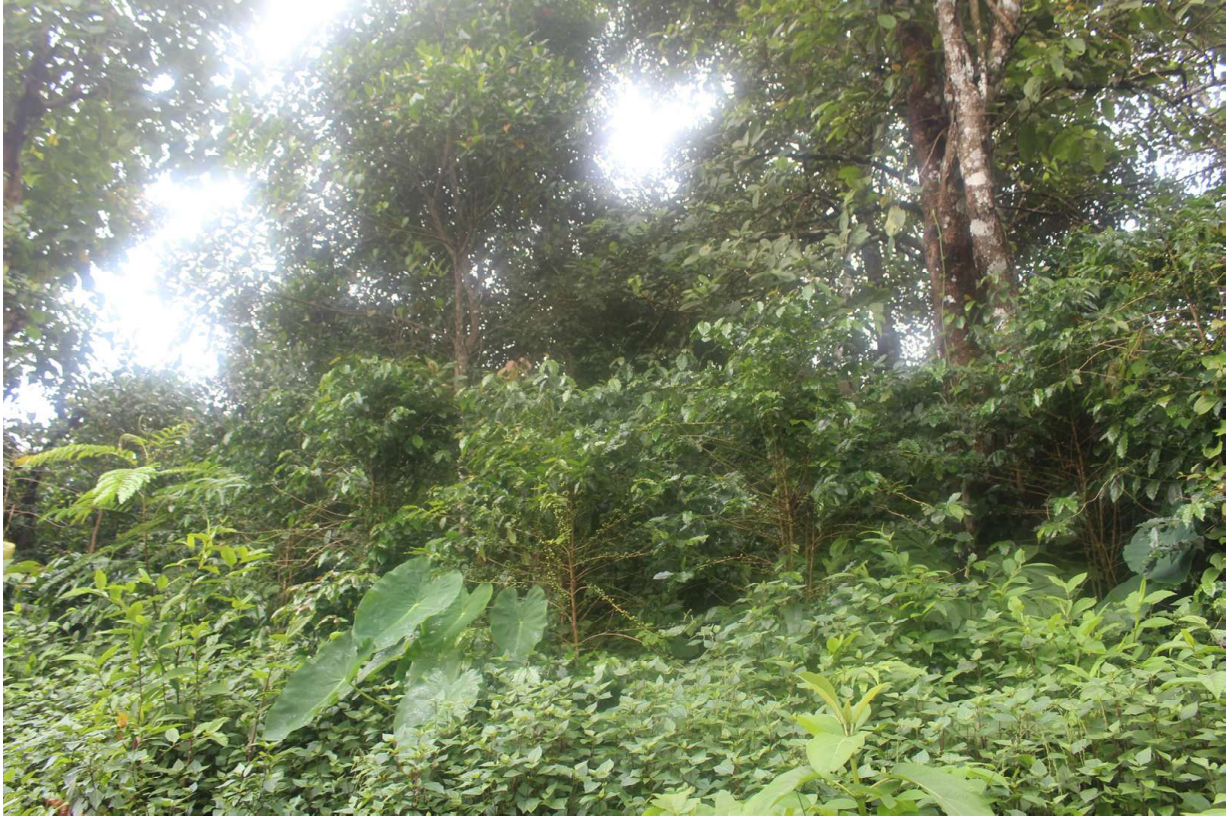
ပုံ(၈) နေအိမ်ခြံဝင်းဥယျာဉ်အတွင်း စိုက်ပျိုးထားသည့် ကော်ဖီခင်း