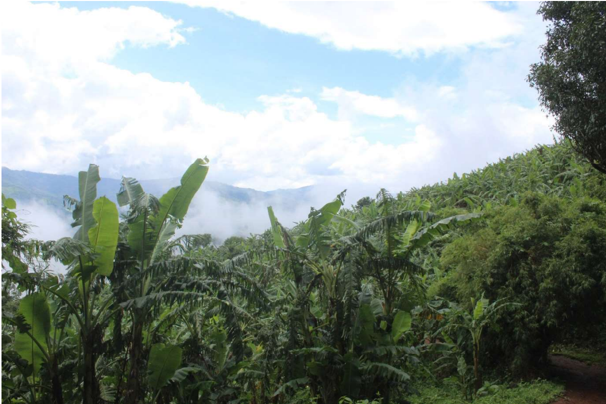
ပုံ( ၇ ) ငှက်ပျောစိုက်ခင်း

သီးနှံထွက်ကုန်များအား မော်တော်ဆိုင်ကယ်ဖြင့် အလွယ်တကူသယ်ပို့နိုင်သည့် လမ်းအနီးဝန်းကျင်၌ ဥယျာဉ်ခြံများကို အများဆုံးစိုက်ပျိုးထားရှိကြပါသည်။ အချို့ရွာသူရွာသားများမှာ သယ်ယူပို့ဆောင်ရေးလမ်းကြောင်းအနီးရှိ မြေယာများကို မပိုင်ဆိုင်ကြသည့်အတွက် ဥယျာဉ်ခြံစိုက်ပျိုးရေးလုပ်ကိုင်ရန် အခက်အခဲရှိပါသည်။ ဥယျာဉ်ခြံများ မစိုက်ပျိုးခြင်း၏ အခြားအကြောင်းရင်းတစ်ရပ်မှာ အခြေချပြောင်းရွှေ့လာသူများ၌ ဥယျာဉ်ခြံစိုက်ပျိုးရေးလုပ်ကိုင်ရန် သင့်တော်သည့် မြေယာမရှိခြင်းကြောင့် ဖြစ်ပါသည်။ အခြားတစ်ဖက်တွင်လည်း ဥယျာဉ်ခြံစိုက်ပျိုးရေးမှာ အချိန်ယူလုပ်ကိုင်ရသည့် စိုက်ပျိုးရေးလုပ်ငန်းလည်း ဖြစ်ပါသည်။