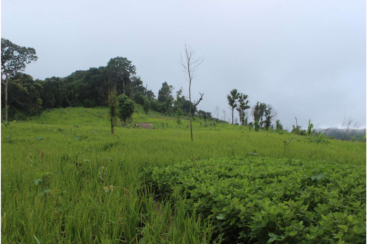
ပုံ(၄) စပါးခင်းနှင့် ပဲပုပ်စိုက်ခင်း