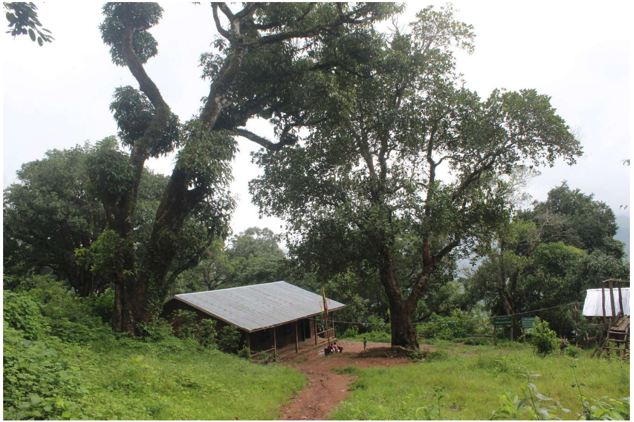
ပုံ(၂) ဆားပေါက်ရွာဟောင်း

ရွာတွင် အခြေခံပညာမူလတန်းကျောင်းရှိပြီး မူလတန်းအဆင့် အောင်မြင်ပြီးသော ကျောင်းသားကျောင်းသူများသည် ရွာနှင့် ၁မိုင်ခန့်ဝေးသည့် ဂုတ်ကြီးရွာ အခြေခံပညာအလယ်တန်းကျောင်းတွင် ဆက်လက်ပညာသင်ယူရပါသည်။ ရွာတွင် ဆေးခန်းများ၊ ကျန်းမာရေးစောင့်ရှောက်မှုဌာနများ မရှိပေ။