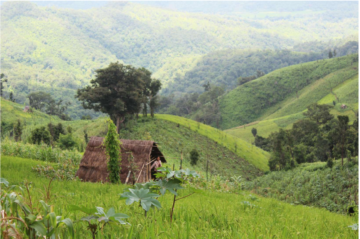
ပုံ( ၆ ) ရွှေ့ပြောင်းတောင်ယာစိုက်ပျိုးရေး သီးနှံမျိုးစုံစိုက်ခင်း (ပြောင်း၊ ကြက်ဆူ၊ ငြုပ် စသည်)