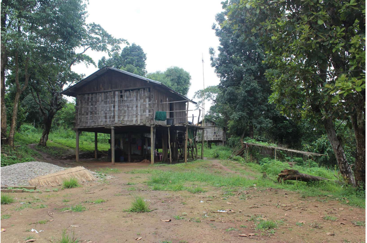
ပုံ(၁) ဆားပေါက်ရွာသစ်