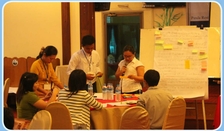
POINT နှင့် RECOFTC မှ ဂူးဝေါင်းစီစဉ်သည့် ရန်ကုန်မြို့ရှိ ဝန်ဒါစားသောက်ဆိုင်တွင်၊ ကျင်းပသော REDD+ အထောက်အပံ့ဖော်ရန်အတွက် လုံခြုံစိတ်ချမှုဆိုင်ရာ အစီအမံများဆိုင်ရာ အလုပ်ရုံဆွေးနွေးပွဲသို့ တက်ရောက်ခဲ့သူများ။