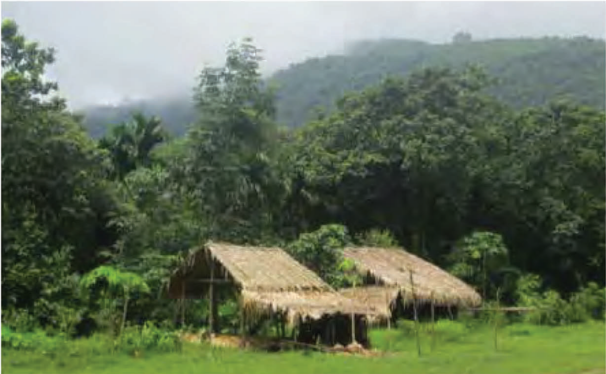
■ ချင်းပြည်နယ်မှ သစ်တောတစ်နေရာ