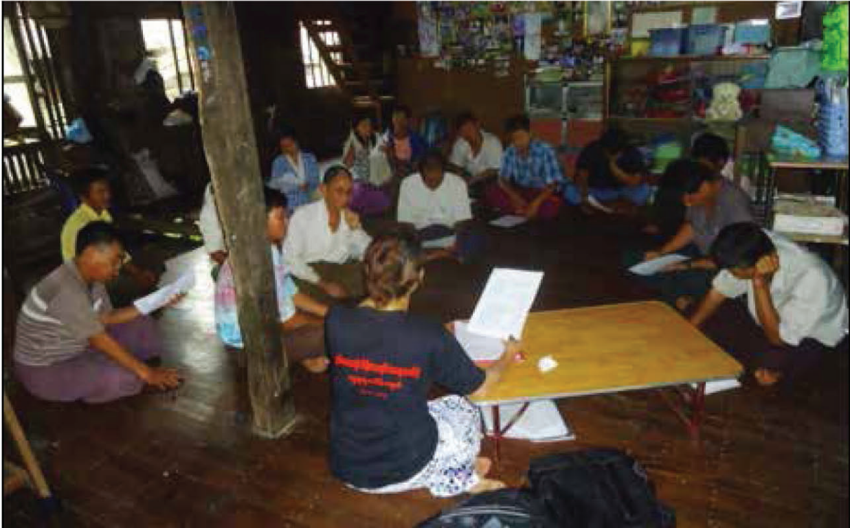
■ ဧရာဝတီတိုင်းဒေသကြီးရှိ အုပ်စုဖွဲ့ဆွေးနွေးခြင်းတစ်ခု (ခါတ်ပုံ - အေးသီရိကျော်)

မြန်မာနိုင်ငံတွင် လွှမ်းမိုးထားသောလူမှုစံနှုန်းများအရ အမျိုးသားများသည် ဦးဆောင်သူအခန်းကဏ္ဍဖြင့် ဦးဆောင်နေချိန်တွင် အမျိုးသမီးများက ထောက်ပံ့ပေးသူအခန်းကဏ္ဍဖြင့် ရှိနေရမည်ဟု လက်ခံထားတတ်ကြသည်။ အမျိုးသားများသည် အိမ်ထောင်မိသားစုကို ကာကွယ်ရန်တာဝန်ရှိပြီး အမျိုးသမီးများက မိသားစုများကို ဂရုပြု၊ ဂရုစိုက်ရသည့် တာဝန်ရှိသည်ဟု လက်ခံကြသည်။ ယခုသုတေသနတွင် တွေ့ဆုံဆွေးနွေးခဲ့သူများ စားဝတ်နေရေးအတွက် အဓိက အသက်မွေးဝမ်းကျောင်းလုပ်ငန်းမှာ တောင်ယာ ၁ စိုက်ပျိုးခြင်းနှင့် ဥယျာဉ်ခြံစိုက်ပျိုးသည့်လုပ်ငန်းဖြစ်သည်။ အခြားအသက်မွေးဝမ်းကျောင်းလုပ်ငန်းများမှာ အမဲလိုက်ခြင်းနှင့် တစ်နိုင်တစ်ပိုင်သစ်ထုတ်ခြင်းတို့ဖြစ်ပြီး အမျိုးသားများကအများစုလုပ်ဆောင်သည်။ အမျိုးသမီးများအနေဖြင့် အစားအစာအတွက် စီစဉ်ခြင်း၊ ဟင်းသီးဟင်းရွက်၊ သစ်သီးနှင့် ဘယဆေးရွက်များကို သစ်တောများမှရှာဖွေပြီး ရောင်းချခြင်းဖြင့် ဝင်ငွေရစေပါသည်။