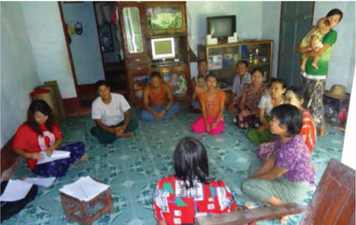
■ တနင်္သာရီတိုင်းဒေသကြီးတွင် အုပ်စုဖွဲ့ဆွေးနွေးခြင်းတစ်ခု

ကွင်းဆင်းသုတေသနပြုသူများသည် တွေ့ဆုံမေးမြန်းမှုမပြုခင်တွင် တုံ့ပြန်ဖြေကြားမည့်သူ၏ သဘောလိုက်လျော့ တူညီမှု ရရှိထားခဲ့သည်။ ဖြေကြားပေးသူအနေဖြင့် မိမိအတွက် သက်တောင့်သက်သာမဖြစ်သော မေးခွန်းကို ဖြေကြားရန်အဆင်မပြေပါက ဆက်မဖြေရန်အခွင့်အရေးရှိသည်ကိုလည်း အသိပေးထားပါသည်။ တုံ့ပြန်ဖြေကြားသူများ၏အမည်များကို ကွင်းဆင်းမေးမြန်းသူများမှ လျှို့ဝှက်သိမ်းဆည်းထားပြီး နေရပ်လိပ်စာများကိုလည်း ပြောင်းလဲဖော်ပြထားပါသည်။