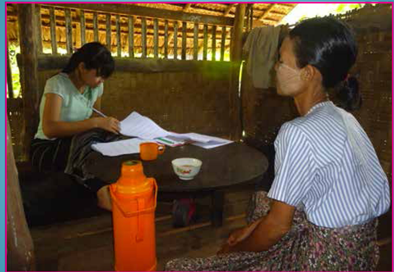
အေးသီဂိုကျော်