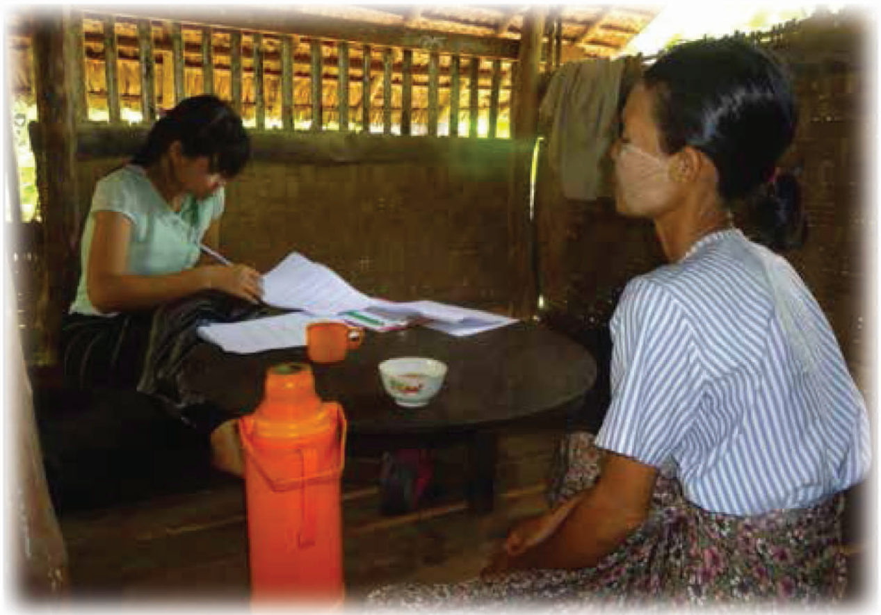
အေးသီရိကျော်